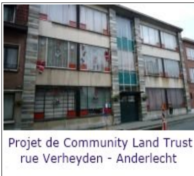
Projet de Community Land Trust rue Verheyden - Anderlecht

Il y a beaucoup d'approches et d'acteurs différents pour améliorer le logement de ceux qui en ont besoin. Nous observons que sur le terrain beaucoup d'associations fourmillent d'idées et de projets mais peinent à les réaliser. Les pouvoirs publics tâtonnent et font des expériences, parfois positives et parfois moins heureuses. Des chercheurs ont des idées mais peu de moyens pour les mettre en pratique. Parmi les entreprises actives dans le secteur de l'Immobilier, certaines souhaitent reconnaître leurs responsabilités et modifier leurs comportements en conséquence. De simples citoyens qui savent ce qu'un bon logement peut signifier dans la vie s'investissent ou investissent leur argent pour que d'autres puissent bénéficier d'un logement convenable qui leur soit reconnu comme un droit.